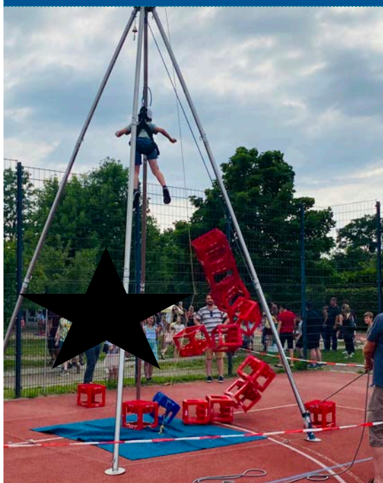
Kisten klettern zum Sommerfest für alle, die keine Angst vor der Höhe hatten

Zum Fasching gab es als Highlight den Knips-O-Mat, damit jedes Kind ein Erinnerungsfoto für zu Hause mitnehmen konnte. Aufgrund der positiven Resonanz kam der Knips-O-Mat dann auch zum Sportfest der 5./6. Klassen und zum Sommerfest zum Einsatz.